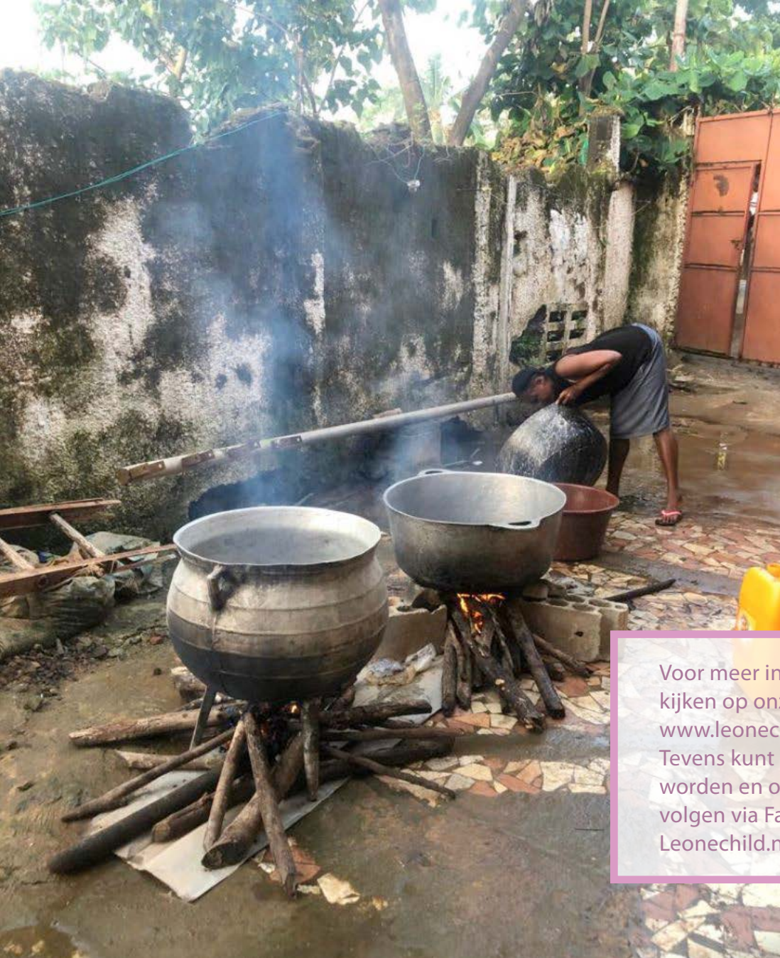
de pannen waar het eten in gemaakt wordt

Voor meer informatie kunt u ook kijken op onze website: www.leonechild.nl . Tevens kunt u vrienden met ons worden en ons op die manier volgen via Facebook: Leonechild.nl