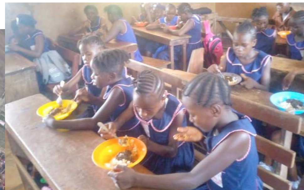
boven: de kinderen genieten van hun lunch, onder: "assembly" voordat de school start